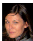
Mag a Gudrun Wagner Universitätsklinik für Kinder- und Jugendpsychiatrie des AKH Wien