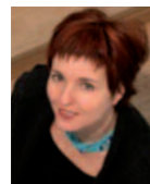
Mag a Rahel Jahoda intakt – Institut für Menschen mit Essstörungen