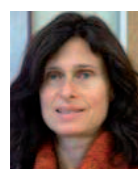
Primaria Dr n Angelika Rießland-Seifert Otto Wagner-Spital