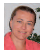
Mag a Sabine Schmid-Sipka sowhat – Institut für Menschen mit Essstörungen